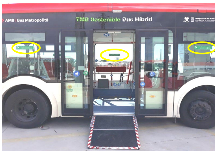
Imagen 1: Salidas emergencia

Estas estarán señalizadas para su fácil localización tanto del exterior como del interior del vehículo según imagen. Se colocarán en las mínimas ventanas necesarias para poder cumplir la normativa según CE 2001/85.